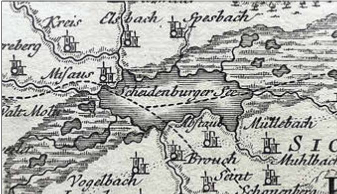
1762, Kartenausschnitt, Heinrich Ludwig Brönner, Frankfurt

Mit der jetzt angebotenen Fotopräsentation berichtet Michael Czok über den „Scheidenberger Woog“. Er geht auf die ursprüngliche Lage des Sees ein, seine Entstehung und sein Verschwinden. Durch die extremen Hochwasserlagen in den letzten Jahren ergibt sich eine starke Verbindung zum ursprünglichen See.