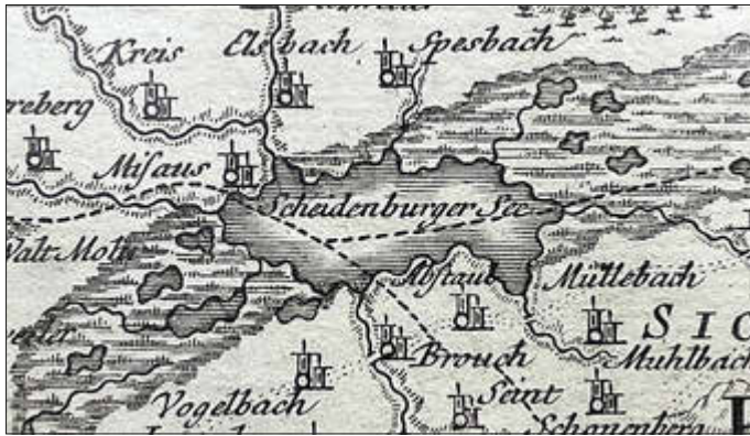
1762, Kartenausschnitt, Heinrich Ludwig Brönnner, Frankfurt

remen Hochwasserlagen in den letzten Jahren ergibt sich eine starke Verbindung zum ursprünglichen See.