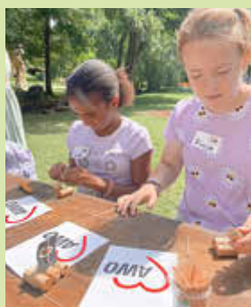
Die Mitarbeiterinnen der Korkensegler Schiffswerft haben alle Hände voll zu tun.