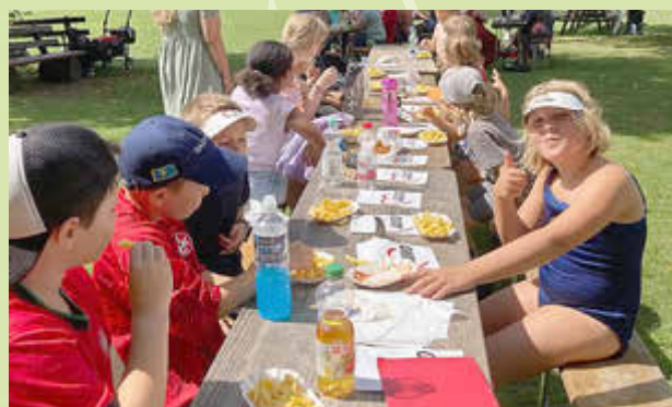
Mittagspause! Pommes mit Majo oder Ketchup? Egal, Hauptsache es schmeckt.