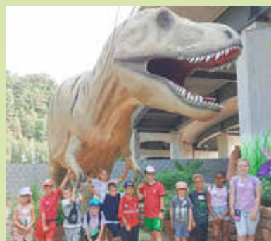
Der Chef-Dino lässt es sich nicht nehmen, die Gruppe höchstpersönlich zu begrüßen.

„Steinreich“ präsentierte sich die Lego-Ausstellung. Die Kinder waren so fasziniert, dass sie sich kaum von Lautern im Gulliver-Format trennen wollten. Aber der Spielplatz Neumühlepark konnte auch begeistern, dort konnte man sich austoben und dabei von den Riesenechsen des Dino-Parks beäugen lassen. Viel Spaß machte auch eine