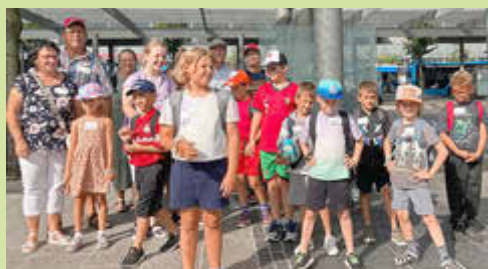
Der Zug war tatsächlich pünktlich. Ankunft am Hauptbahnhof Kaiserslautern.

„Segelregatta“ auf der Lauter, mit kleinen, zuvor selbstgebastelten Korkenschiffchen. Dazwischen gab es, wer kann da schon nein sagen, zur Stärkung die obligatorische Portion Pommes.